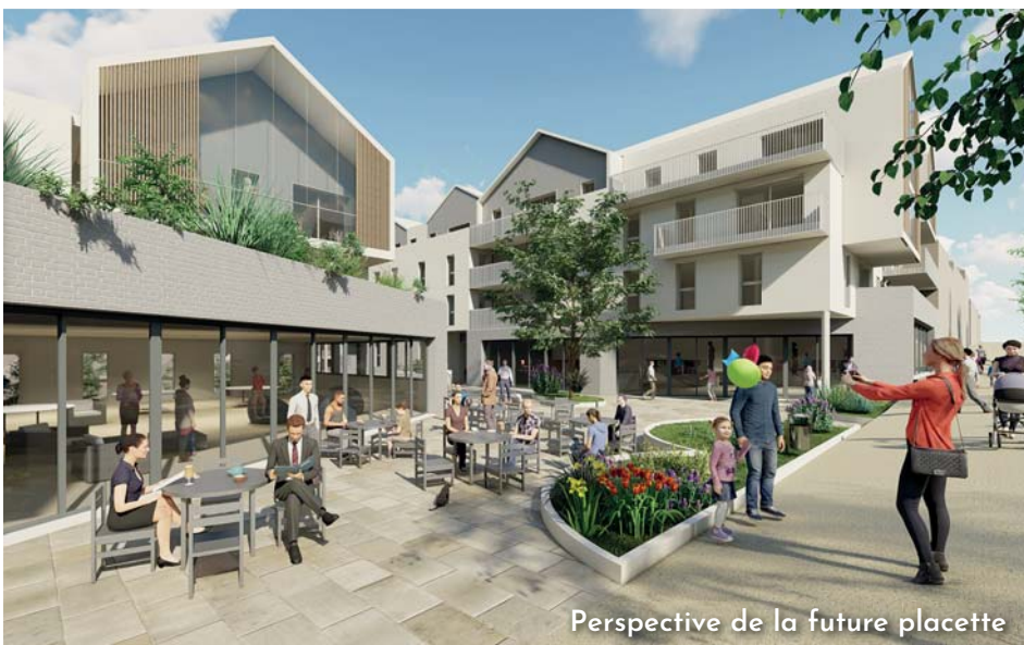
Perspective de la future placette

L'ordre du jour sera consultable sur le site de la ville www.saint-berthevin.fr à compter du 8 novembre et du 13 décembre prochains.