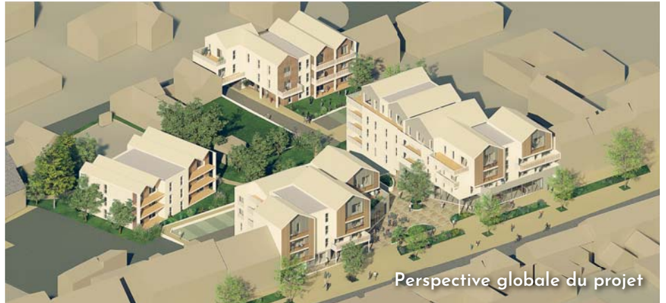
Perspective globale du projet

Le projet comprend la construction de 4 bâtiments collectifs regroupant 60