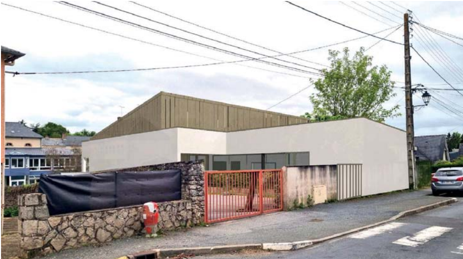
Insertion du futur restaurant scolaire vue de la rue Alain Gerbault

Par délibération du 10 novembre 2022, il avait été acté du programme de construction du restaurant scolaire et de l'accueil périscolaire pour l'école Jeanne d'Arc. L'étude avait alors été confiée à l'architecte mayennais Anthony MORIN. Prévu à l'arrière de l'école, côté rue Alain Gerbault, le futur bâtiment, d'une surface de 305 m 2 , s'organisera autour de deux salles : l'une pour les maternelles, avec un service de restauration à table, et l'autre en mode self pour les élémentaires. Ces deux salles pourront être mutualisées et affectées en salle d'accueil périscolaire. Différents locaux composeront le reste du bâtiment : des locaux techniques et d'entretien, un bureau, des vestiaires et sanitaires et une cuisine équipée d'un