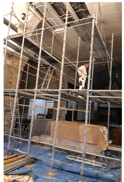
Les travaux de peinture du chœur de l'église