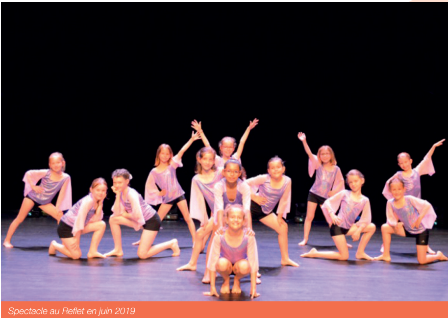
Spectacle au Reflet en juin 2019