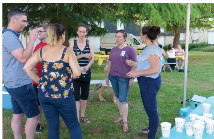
Le pique-nique du quartier en 2019

Plus d'informations au Lien : 02.85.68.00.10