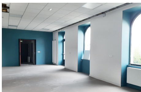
La salle Concise (ex-salle Primevère) refaite à neuf