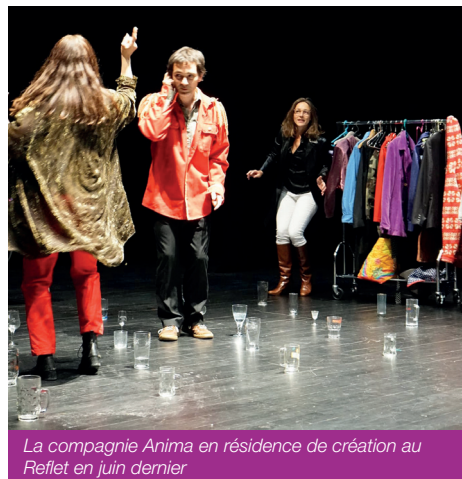
La compagnie Anima en résidence de création au Reflet en juin dernier

Une fois la sélection faite et définitivement arrêtée au cours du printemps, les contrats sont officialisés avec les artistes, les compagnies et les prestataires pour d'éventuelles locations de matériel spécifique ou d'instruments. Les équipes techniques nécessaires pour chaque évènement sont constituées ; des techniciens son et lumière intermittents viennent parfois en renfort du régisseur de la salle. Il est prévu également le personnel en charge de la sécurité incendie.